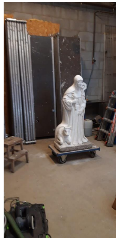
Het beeld in het atelier