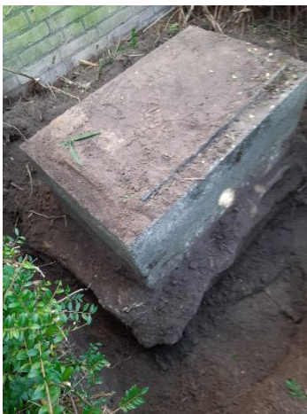
De oude sokkel