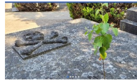
Kerkhof Bavel Nieuw-Ginneken

https://www.facebook.com/Kerkhof-Bavel-104410621933074/